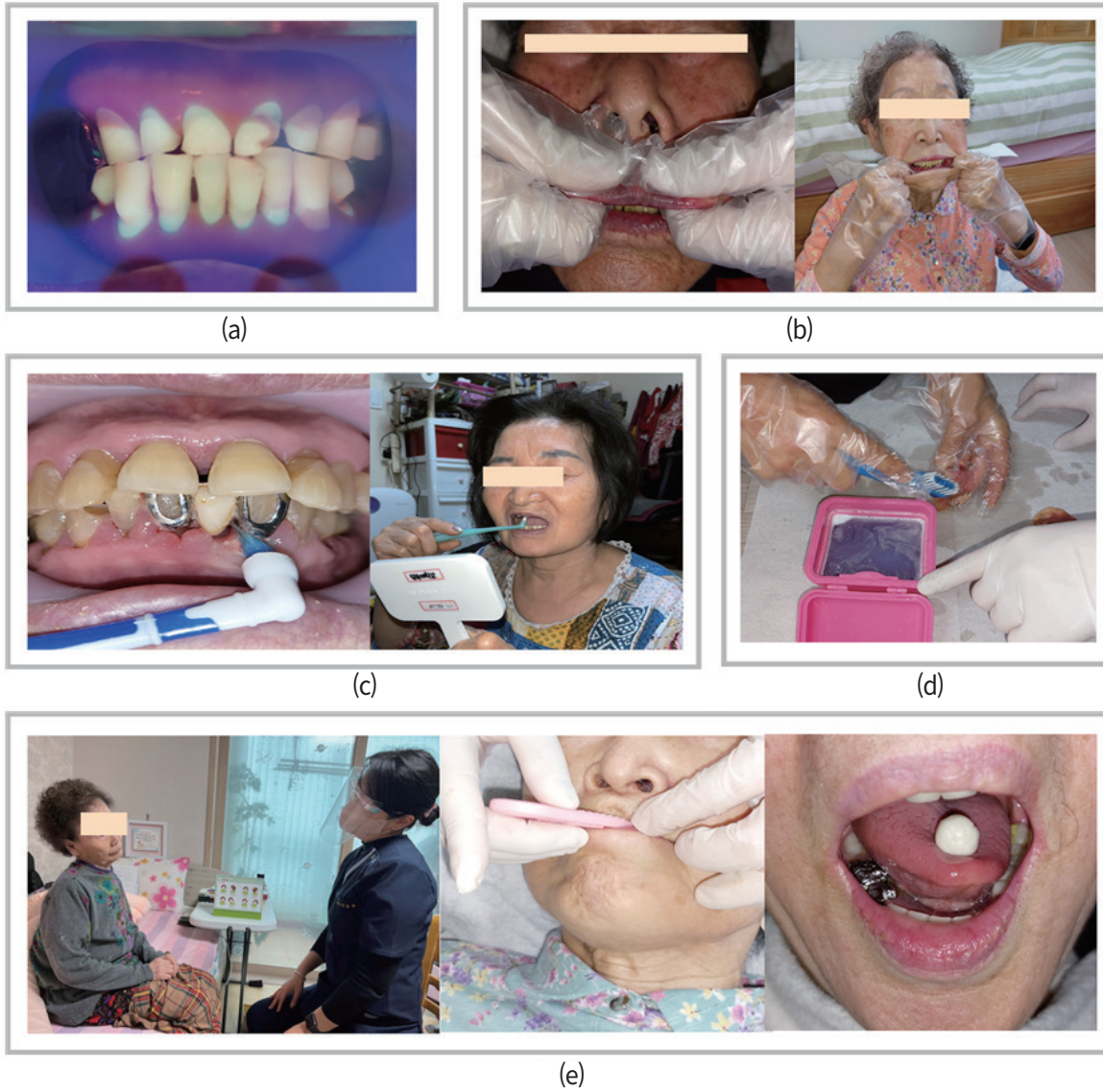
Fig. 1. Home oral care intervention activities; (a) Photographing oral status; (b) Oral massage; (c) Oral hygiene care I; (d) Oral hygiene care II; (e) Training for oral muscle strengthening