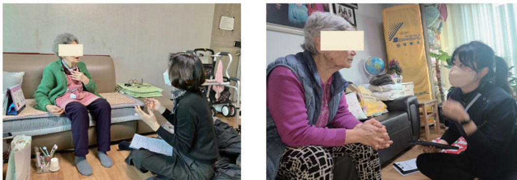
Fig. 2. Interview after home oral care intervention program